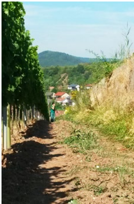
Pozidne kuščarice ( Podarcis muralis ) se pogosto pojavljajo na kmetijskih površinah, kot so npr. vinogradi, kjer je raba pesticidov pogosta.

Primerjava v občutljivosti na toksične substance. (vir: Mingo et al., 2016. Risk of pesticide exposure for reptile species in the European Union. Environmental Pollution 215: 164–169.) Znanje o vplivih pesticidov na plazilce je še vedno relativno slabo, vendar pa so v Nemčiji v preteklem letu naredili preskus vpliva pesticidov na pozidne kuščarice ( Podarcis muralis ).