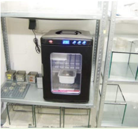
Glavni rezultat raziskave o vplivu pesticidov na pozidne kuščarice ( Podarcis muralis ) so pokazali, da lahko negativno vplivajo preko vstopa čez lupino jajca v zemlji in imajo negativen vpliv na razvoj zarodka.