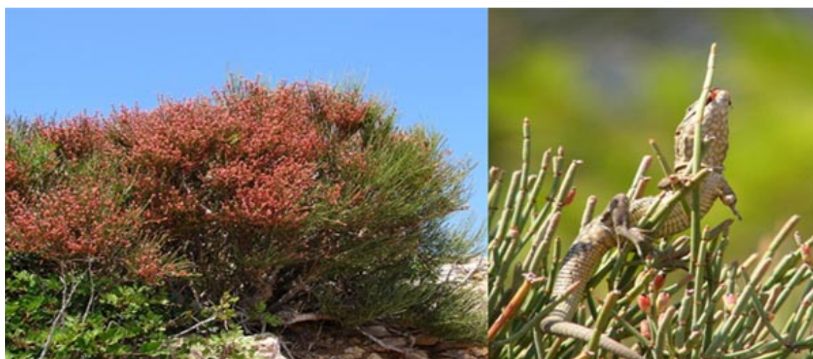
Figura 1. Individuo de Ephedra fragilis cargado de frutos en el islote de Sa Dragonera. Los frutos son activamente consumidos por lagartija balear ( Podarcis lilfordii ) (derecha).

Los reptiles son un importante dispersor de frutos carnosos en muchos ecosistemas insulares (Olesen y Valido, 2003), en los que muchas veces representan el principal dispersor de la flora nativa o endémica, hasta el punto de que su desaparición a consecuencia de la intervención humana puede llevar aparejada la extinción de dicha flora (Riera et al. , 2002; Traveset y Riera, 2005; Traveset y Santamaría, 2005). Incluso algunas especies comunes en áreas continentales dependen a veces de los reptiles para la dispersión en sus poblaciones insulares. Un ejemplo de esta relación se da con la efedra ( Ephedra fragilis ), un arbusto presente en áreas costeras y montañosas mediterráneas con frutos carnosos típicamente dispersados por aves en la península ibérica, pero que dependen principalmente de la dispersión por lagartija balear ( Podarcis lilfordii ) en algunas islas e islotes del archipiélago balear, como el Parque Natural de Sa Dragonera, en Mallorca ( Fig. 1 ).