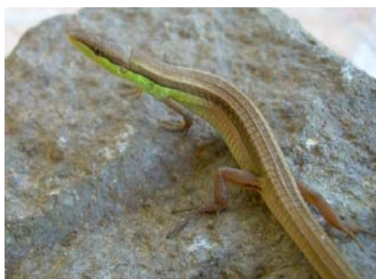
Gambar 1. Kadal betina Takydromus sexlineatus .

Dari pengamatan morfologi secara kuantitatif, antara kadal jantan dan betina dewasa menunjukkan perbedaan pada berat badan dan panjang kepala-badan. Pada kadal jantan tampak memiliki berat badan rata-rata lebih tinggi dari pada betinanya, yaitu masing-masing