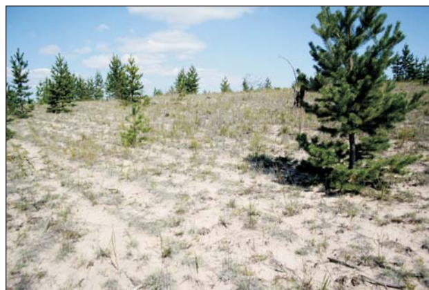
Рис. 1. Места обитания Ph. h. varius. Молодые сосновые насаждения на участке гари (30.07.2016 г., Алтайский край, Угловский район).

пекты экологии данных видов. Температура поверхности грунтов измерялась цифровым пирометром MS6520A, предназначенный для измерения инфракрасного (ИК) излучения поверхностей объектов. Погрешность по техническим характеристикам составляет 0.1 °С, а коэффициент эмиссии – 0.95. С учётом высокого коэффициента эмиссии пирометра температура поверхностного слоя грунта может коррелироваться в сторону увеличения: мертвопокровного грунта на 2 – 4 °С; открытого песка не менее чем на 1 – 2 °С.