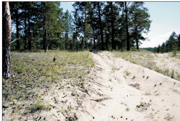
Рис. 3. Места обитания E. a. arguta. Противопожарная борозда в Барнаульском ленточном бору (30.07.2016 г. Алтайский край, Рубцовский район).

Первое появление Ph. h. varius и E. a. arguta отмечено 16 апреля. Беременная самка Ph. h. varius была отловлена на мертвопокровном грунте в ленточном бору, а два самца и самка E. a. arguta – на линии противопожарного рва на открытом песке. Дневная температура +21–23°C, ночная +5–7°C, погода ясная, время фиксирования 15.00–16.30 ч. Температура мертвопокровного участка грунта +31–33°C, открытого песка +29°C. Примерно через месяц (14 мая), там же, на участке мертвопокровного грунта под кронами деревьев, отмечены два самца и самка Ph. h. varius , а на границе противопожарного рва и редкого травостоя – три самца, две самки и три молодые особи E. a. arguta . Дневная температура +25–27°C, ночная – +13–14°C, ясно, время фиксирования с 9.00 до 13.00 ч. Температура почвы: открытые пески +25–29°C, мертвопокровный грунт +33–40°C. Все ящерицы были активны, и при их обнаружении пытались скрыться. В период проведения учетов с первой декады июня по третью декаду июля в крае установилась аномально жаркая и сухая погода. В отдельные дни дневная температура поднималась до +38°C, а ночные не опускались ниже +25°C. На исследуемых территориях (рис. 4) (Егорьевский, Рубцовский, Угловский районы)