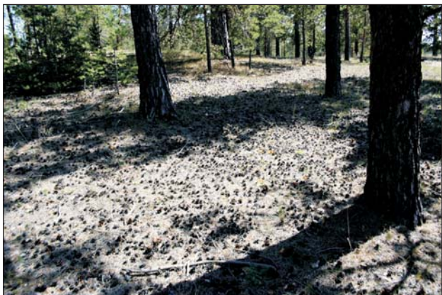
Рис. 2. Места обитания Ph. h. varius. Мертвопокровный участок соснового леса (30.07.2016 г. Алтайский край, Угловский район).