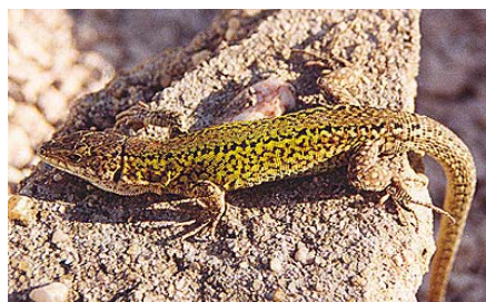
Macho de Podarcis carbonelli .

Versiones anteriores: 3-03-2004; 15-12-2004; 14-12-2006; 28-01-2008