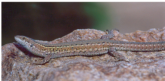
Hembra de Podarcis carbonelli .