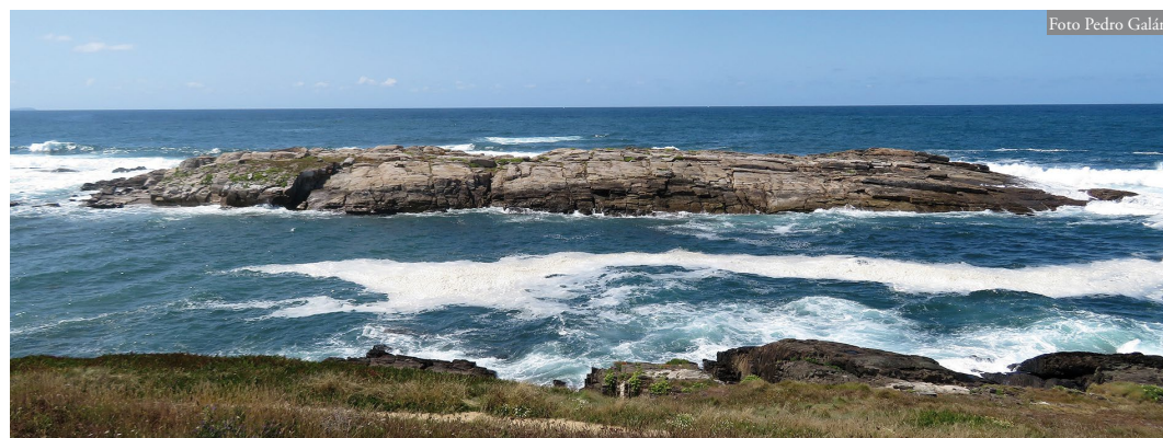
Figura 1: Isla Redonda, frente a la costa de A Coruña. Se trata de un islote muy pequeño y muy cercano a tierra, habitado por Podarcis bocagei , cuya población se concentra en su tercio sureste (izquierda de la fotografía).

El 1 de agosto de 2019 se observó un total de 16 individuos diferentes en la isla en 3