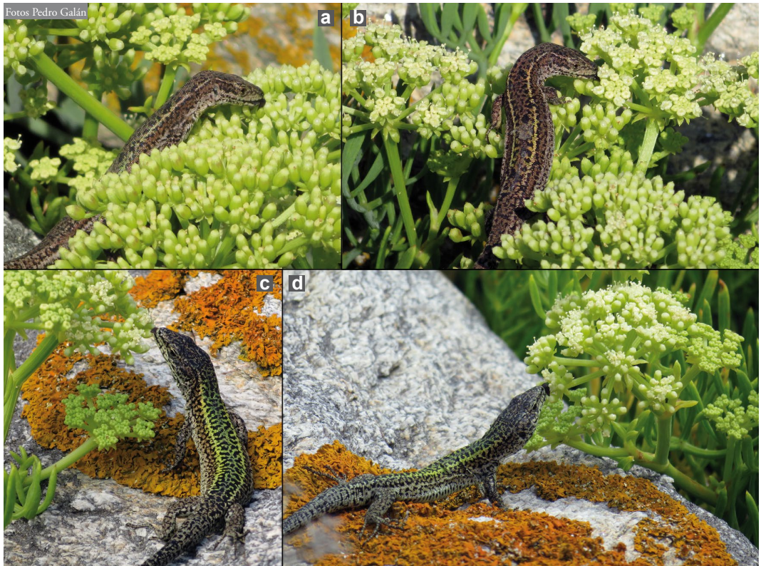
Figura 2: Ejemplares de Podarcis bocagei lamiendo las inflorescencias de Crithmum maritimum en la isla Redonda. a) y b) Una hembra encaramada a la planta. c) y d) Un macho lamiendo las flores desde una roca.

horas y 30 minutos de muestreo, de los cuales dos lamían flores de C. maritimum . Uno de ellos era un macho adulto, que fue observado en dos ocasiones diferentes lamiendo distintas inflorescencias, pero sin trepar a ellas, desde una roca (Figura 2c y d). El segundo ejemplar era una hembra subadulto que también lamía las flores desde la roca donde permanecía.