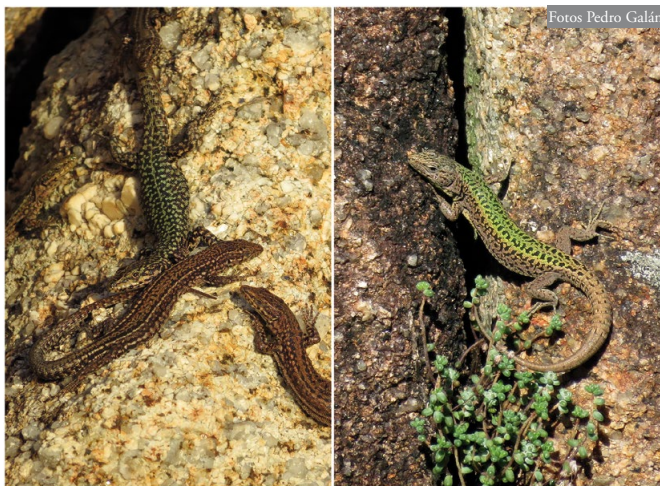
Figura 3: Izquierda, Podarcis guadarramae , un macho adulto rodeado de varias hembras (O Pedrullo, Pindo). Derecha, Podarcis bocagei , macho adulto (Alto das Cortes, Pindo). Ambas especies ocupan los medios rocosos de este monte, incluso P. bocagei , en principio no saxícola y mucho menos trepadora que P. guadarramae ; sin embargo, se observaron diferencias en el uso de los microhábitats (ver texto).

gei , sin embargo, utilizó estos dos sustratos de vegetación y tierra con cierta frecuencia (Tabla 2). Estas diferencias en el tipo de sustrato seleccionado resultaron altamente significativas entre ambas especies ( \chi^2 = 33,36 ; gdl = 4; P < 0,0001 ). En cuanto al tipo de refugio buscado cuando se sienten amenazadas, también se observaron marcadas diferencias entre las dos especies. Podarcis guadarramae seleccionó principalmente las grietas en las rocas, mientras que P. bocagei lo hizo entre la vegetación y en pocas ocasiones trepó a alturas elevadas en los roquedos, como con frecuencia hace P. guadarramae (Tabla 2). Estas diferencias en las zonas de refugio también resultaron altamente significativas ( \chi^2 = 33,01 ; gdl = 3; P < 0,0001 ).