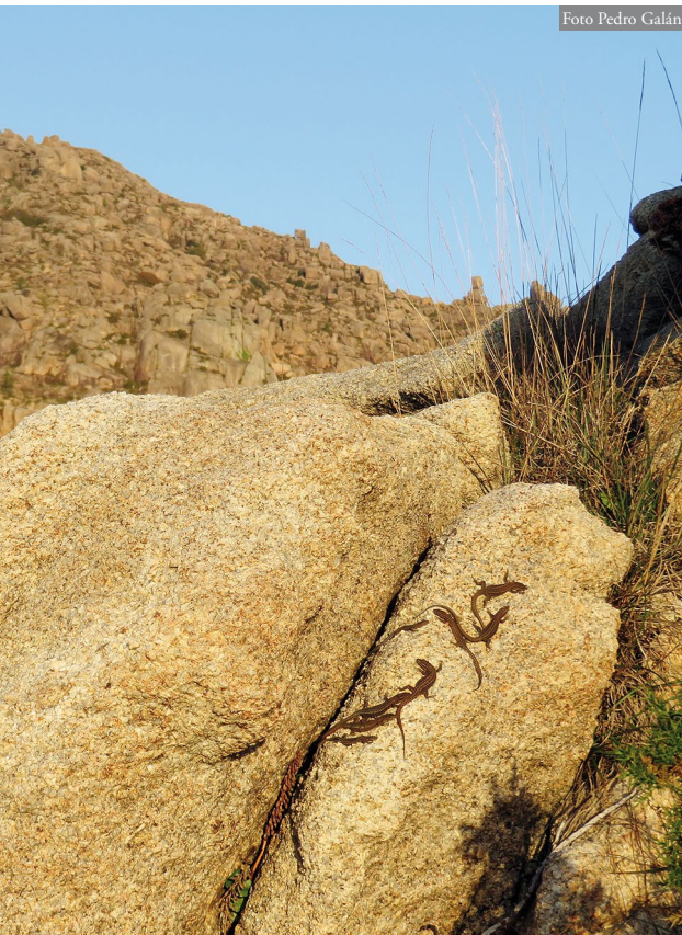
Figura 2: Ladera oeste del Monte Pindo y, en primer plano, a la derecha, grupo de ocho Podarcis guadarramae termorregulando sobre la roca. Esta especie es muy abundante en las laderas oeste y sur de este espacio natural; sin embargo, no está presente en las laderas este y noreste, que ocupa P. bocagei .

En cuanto al tipo de sustrato ocupado, la roca, como superficie mayoritaria en el Pindo, fue la más utilizada por ambas especies (Figura 3); sin embargo la frecuencia de ocupación de las superficies rocosas fue mucho mayor en P. guadarramae , que no se observó sobre la vegetación ni sobre la tierra desnuda. Podarcis boca-