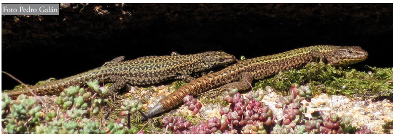
Figura 4: Sólo en determinadas zonas del Monte Pindo coexisten las dos especies de Podarcis (ver Figura 1), pero en ellas no es infrecuente observarlas juntas, en sintopía. Machos adultos de P. guadarramae (izquierda) y de P. bocagei (derecha) en estrecha proximidad.

obtenidos, P. guadarramae se comporta como una especie muy saxícola, en contraste con P. bocagei , mucho menos trepadora, que utiliza menos las grietas y está más ligada al suelo y a la vegetación. Sin embargo, a pesar de ello, P. bocagei también ocupa en el Pindo los medios rocosos, tanto en las zonas donde coexiste con P. guadarramae , como donde es la única especie del género presente (todas las laderas noreste y este del Pindo), en principio, poco adecuadas para una especie no saxícola. No obstante, como se ha visto, la abundancia que alcanza P. bocagei en estos hábitats rocosos, estimada mediante IKA, es muy inferior a las que tiene P. guadarramae , mucho más saxícola y adaptada a estos medios, al menos en las zonas donde estas especies aparecen en alopatría.