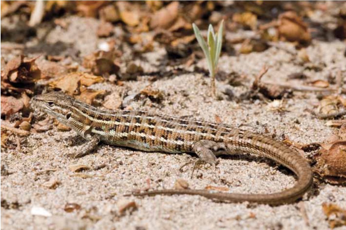
Sargantaner petit adult

reproductor. Aquesta espècie és força generalista i entre les seves preses preferides destaquen les aranyes, els heteròpters, les formigues, les erugues i petits coleòpters. Sembla preferir preses d'activitat terrestre i es mostra poc hàbil per a caçar insectes voladors.