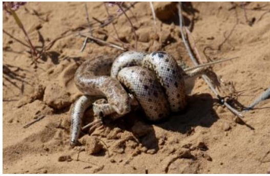
Рис. 2. Успешно завершенная охота песчаного удавчика на разноцветную ящурку, май 2018 г.

Кроме того, обследование убежищ и типичных мест локомоций разноцветной ящурки не выявило следов охоты на них хищных млекопитающих и птиц (следов погони, разрушенных убежищ, выпавших шерсти или перьев и др.), но мы встретили четырех особей со следами нападения хищников на теле.