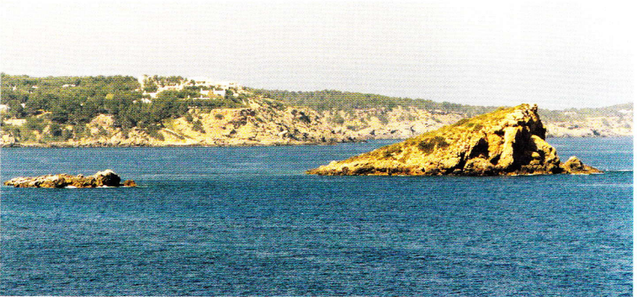
Abb. 7. Illa de Es Canar vor der Ostküste Ibizas.