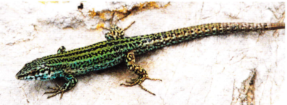
Abb. 8. Männchen von Podarcis pityusensis canensis von der Illa de Es Canar, Ost-Ibiza.