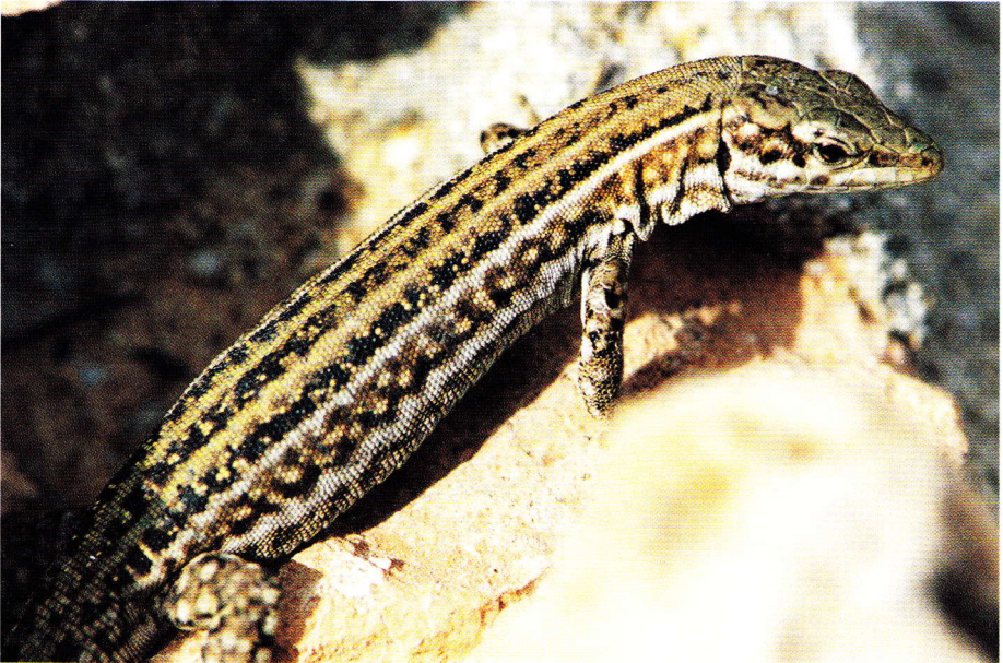
Abb. 3. Weibchen der Nominatform Podarcis pityusensis pityusensis von Ibiza.

Die bräunlichen Flanken sind von hellen Rückenseitenlinien von der Rückenmitte abgegrenzt. Diese ist bei den Männchen gewöhnlich grün gefärbt (Abb. 2), bei den Weibchen überwiegend bräunlich, und wird von drei schwarzen Längsbändern geziert. Zu den Flanken hin tragen die Tiere noch je eine hellere Rückenseitenlinie, die weißlich, bräunlich oder auch grünlich gefärbt sein kann (Abb. 3). Die Bauchseite ist bei den meisten Tieren weißlich gefärbt, kann aber auch orange Farbtöne tragen.