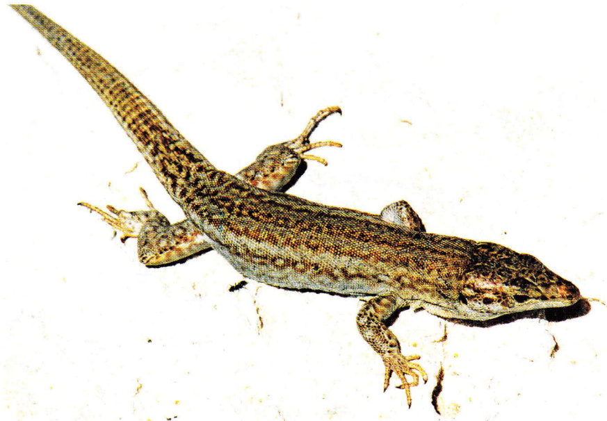
Abb. 5. Männchen von Podarcis pityusensis formenterae von Trocados, Nord-Formentera.