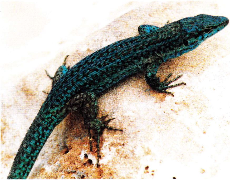
Abb. 4. Männchen von Podarcis pityusensis formenterae vom Cap de Barbaria, Südwest-Formentera.