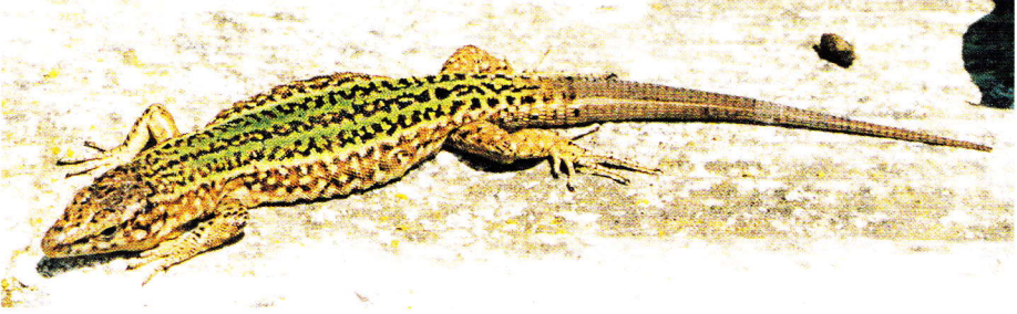
Abb. 2. Männchen der Nominatform Podarcis pityusensis pityusensis von Ibiza.