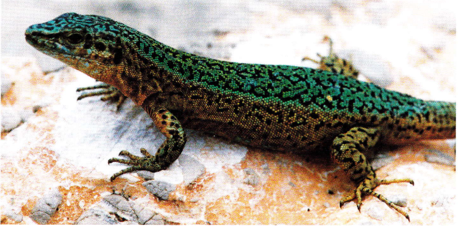
Abb. 6. Männchen von Podarcis pityusensis redonae von der Illa Grossa de St. Eulalia, Ost-Ibiza.