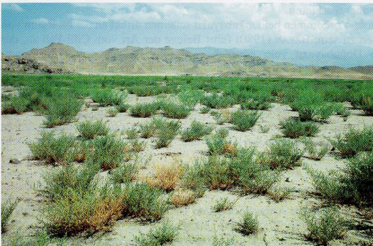
Abb. 8. Lebensraum von Eremias trauchi südlich von Iğdır, 800 m (Prov. Kars). Weitere Amphibien- und Reptilienarten: Pelobates syriacus , Bufo viridis , Eremias pleskei , Phrynocephalus helioscopus , Malpolon monspessulanus , Vipera lebetina .

Habitat of E. suphani 9 km south of Ahlat, 1650 m (Bitlis prov.). Additional amphibians and reptiles: Bufo viridis , Testudo graeca , Lacerta media , Ophisops elegans , Trapelus ruderatus .