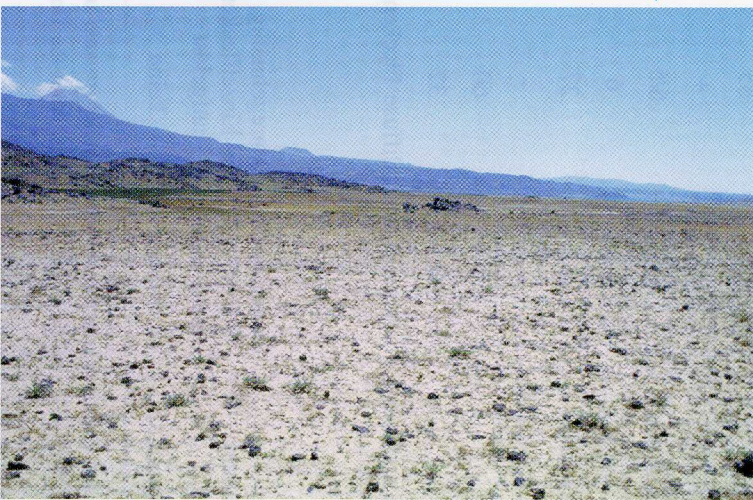
Abb. 6. Lebensraum von Eremias strauchi nordöstlich von Karabulak, 1500 m (Prov. Ağrı). Weitere Amphibien- und Reptilienarten: Pelobates syriacus , Bufo viridis , Eremias pleskei , Phrynocephalus helioscopus , Natrix tessellata ; im Bereich der Felsen Laudakia caucasia und Coluber schmidtii .

Habitat of E. suphani west of Özalp (Van prov.). Additional amphibians und reptiles: Bufo viridis , Rana ridibunda , R. macrocnemis complex, Ophisops elegans .