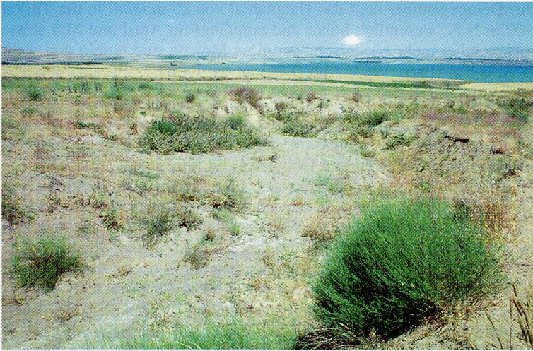
Abb. 7. Lebensraum von Eremias suphani 9 km südlich von Ahlat, 1650 m (Prov. Bitlis). Weitere Amphibien- und Reptilienarten: Bufo viridis , Testudo graeca , Lacerta media , Ophisops elegans , Trapelus ruderatus .

Habitat of E. suphani 9 km south of Ahlat, 1650 m (Bitlis prov.). Additional amphibians and reptiles: Bufo viridis , Testudo graeca , Lacerta media , Ophisops elegans , Trapelus ruderatus .