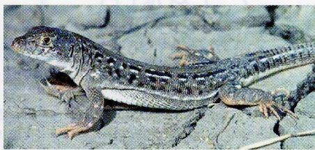
Abb. 2. Eremias suphani (westl. Özalp).