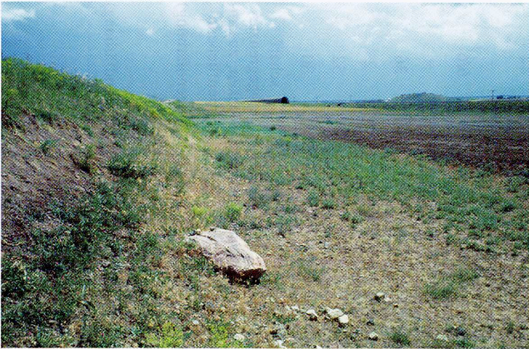
Abb. 5. Lebensraum von Eremias suphani westlich von Özalp (Prov. Van). Weitere Amphibien- und Reptilienarten: Bufo viridis , Rana ridibunda , R. macrocnemis -Komplex, Ophisops elegans .

Habitat of E. suphani west of Özalp (Van prov.). Additional amphibians und reptiles: Bufo viridis , Rana ridibunda , R. macrocnemis complex, Ophisops elegans .